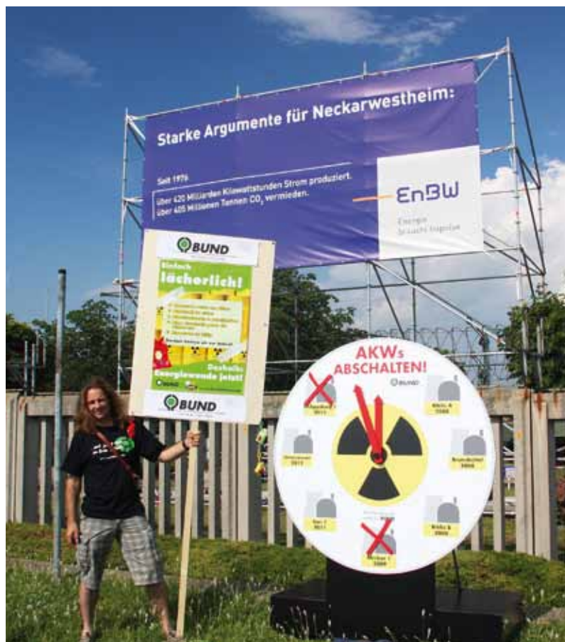
BUND-Protest vor dem Atomkraftwerk Neckarwestheim

Die EnBW ist an vielen Stadtwerken in Baden-Württemberg beteiligt und hält die allermeisten Strom-Konzessionen in Baden-Württemberg. Nur wenige der Stadtwerke mit EnBW-Beteiligung