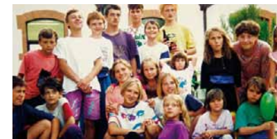
Tschernobylkinder zu Besuch in Schönau