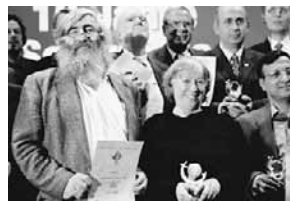
Europäischer Solarpreis 2003