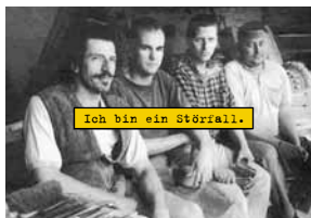
Kampagne zum Netzkauf 1997

Einziger Anbieter mit Gesamtnote „sehr gut“ 03/2004